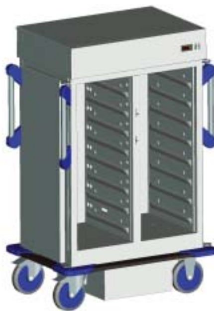
TTW-FK 16-115 DSZE (illustratie) Nieuw bij BLANCO met circulatieluchtkoeling en alle voordelen van het ergonomische BLANCO INMOTION design.