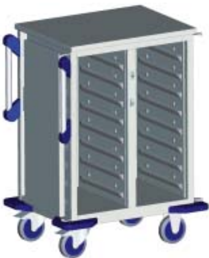
TTW-F 16-105 ESZG (illustratie) Ergonomisch en compact in het BLANCO INMOTION design.

Door de actieve circulatieluchtkoeling wordt ervoor gezorgd, dat de koude gerechten betrouwbaar en onder naleving van de hygiënerichtlijnen verder worden gekoeld.