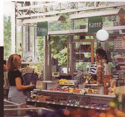
Tankstations, autobedrijven, convenience-shops