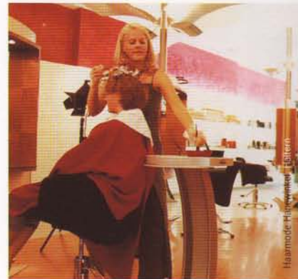
Kapsalons en schoonheidssalons