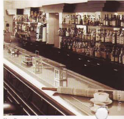
Hotelbars, wachtruimten enz.